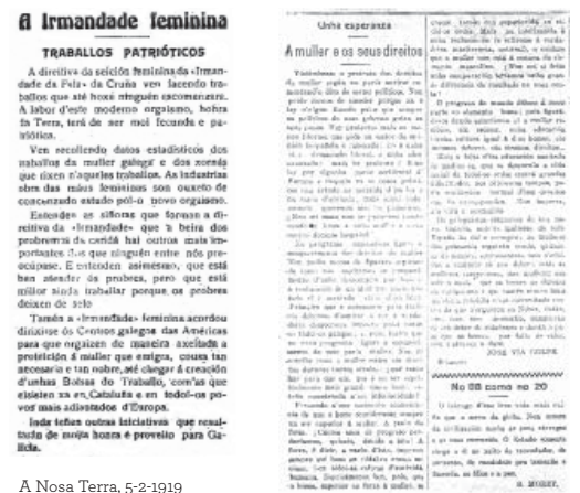
A Nosa Terra, 5-2-1919