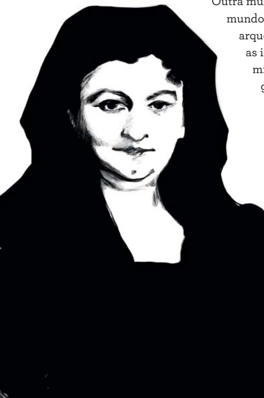
Emilia Pardo Bazán

Outra muller precursora foi Rosalía de Castro , que exerceu de artista nun mundo dominado por varóns e rachou, na súa vida e obra literaria, co arquetipo de muller romántica. Rosalía denunciou coa súa pluma as inxustizas que sometían á nosa nación e puxo de manifesto a miseria e aldraxe que afectaban dun xeito especial ás mulleres galegas. Tamén tería unha importante repercusión pública a monfortina Juana de Vega, de pensamento liberal e asidua dos ambientes progresistas nos que se movían destacadas figuras decimonónicas como o Capitán Solís, alzado en armas contra o centralismo en 1846.